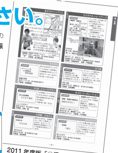
2011 年度版「〇得ガイドブック」

★詳細はホームページまたは、事務局（☎03-5450-7121）にお問合せください。